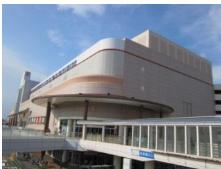
近隣大型ショッピングセンター