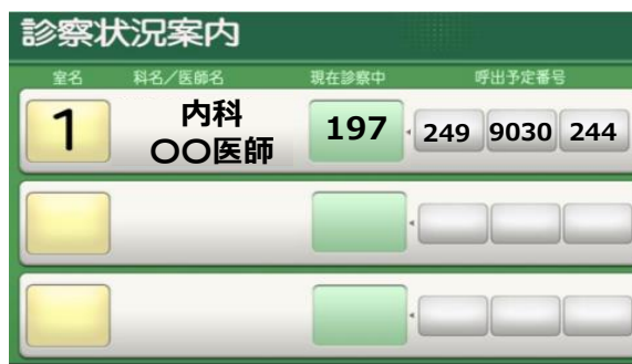
<診察待合番号表示モニター>

※診察待合番号表示モニターを使用していない診療科については、アプリ上でも「診察の待合番号」は表示されません。